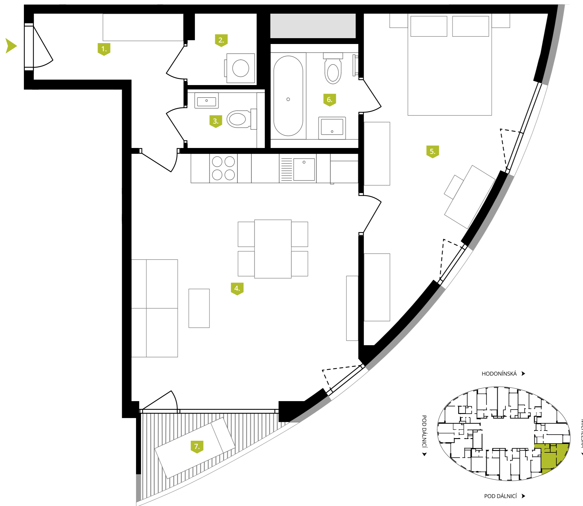
Schéma půdorysu představuje předpokládané dispoziční řešení. Kuchyňská linka, spotřebiče a nábytek nejsou součástí bytu.